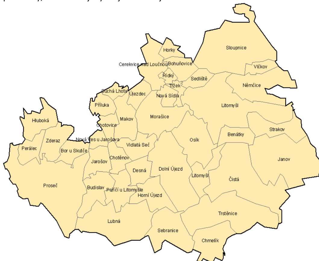
Mapa – území působnosti MAS Litomyšlsko

Území MAS Litomyšlsko sdružuje převážně obce do 500 obyvatel. Pouze malou část tvoří obce s 500 – 1000 obyvateli a obce nad 1000 obyvatel. Dále do území MAS patří dvě města. Společnou charakteristikou tohoto území je převažující část obcí do 500 obyvatel, které se potýkají se shodnými či podobnými problémy jako je nedostatečná dopravní obslužnost, vzdálenost větších měst, nedostatek zejména kvalitních pracovních příležitostí, což způsobuje odchod mladých lidí za prací do měst, je zde málo kulturních, sportovních zařízení a služeb nejen pro obyvatele tohoto území, ale i pro turisty, což zabraňuje rychlejšímu rozvoji cestovního ruchu.